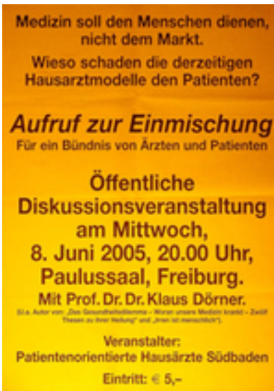
Medizin soll den Menschen dienen, nicht dem Markt. Zusätzliche Infos: Freiburg, 2005, DIN A2