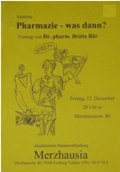
Pharmazie-was dann? Zusätzliche Infos: Freiburg, DIN A3