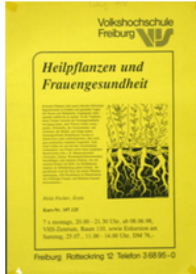
Heilpflanzen und Frauengesundheit Zusätzliche Infos: Freiburg, 1998, DIN A3