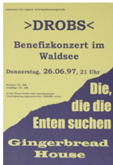
Drobs. Die, die die Enten suchen. Zusätzliche Infos: Freiburg 26.06.1997