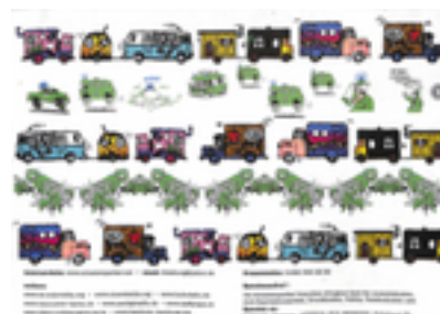
Comic-Blatt Zusätzliche Infos: Freiburg 2005, DIN A3