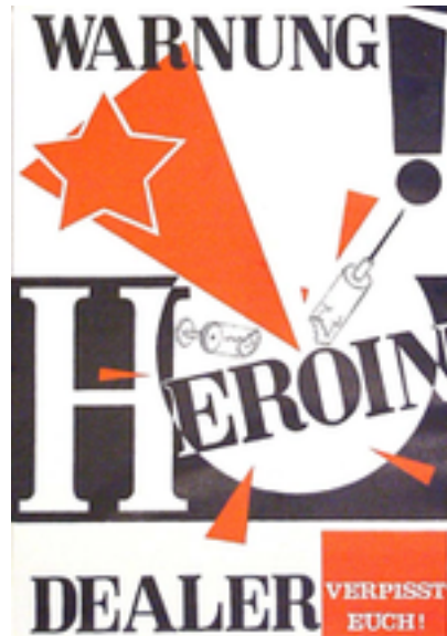
Warnung! Heroin-Dealer verpisst euch!