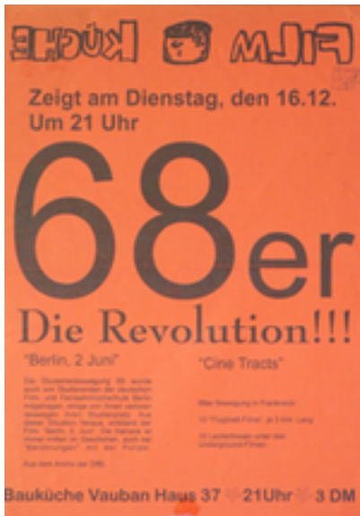
68er-Die Revolution Zusätzliche Infos: Freiburg, DIN A3