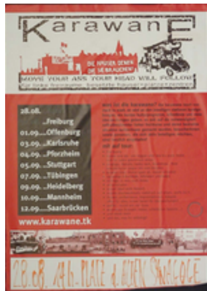
Karawane. für linke freiräume, besetzte häuser + plätze + zentren Zusätzliche Infos: DIN A2