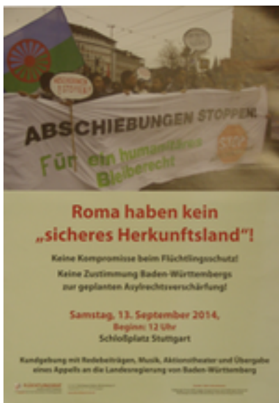
Roma haben kein "sicheres Herkunftsland!" Zusätzliche Infos: Stuttgart 2014, DIN A2