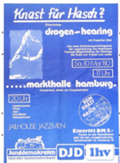
Knast für Hasch? Zusätzliche Infos: Hamburg 10.05.1980, DIN A2