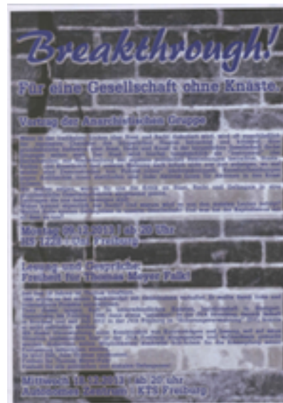
Breakthrough! Für eine Gesellschaft ohne Knäste Zusätzliche Infos: Freiburg 2013, DIN A3