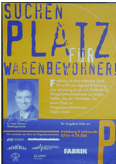
Suchen Platz für Wagenbewohner! Zusätzliche Infos: Format: A1 Freiburg, DIN A2