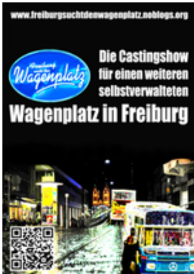
Freiburg sucht den Wagenplatz