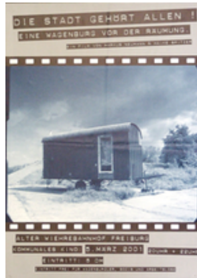
Die Stadt gehört allen! Zusätzliche Infos: Freiburg, DIN A2